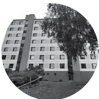
Asunto Oy Näsinlaine / Tampere