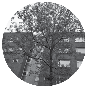
Asunto Oy Neilikketö / Vantaa