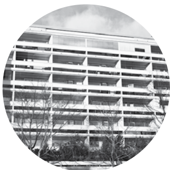
Asunto Oy Lauttasaaren Keskus / Helsinki