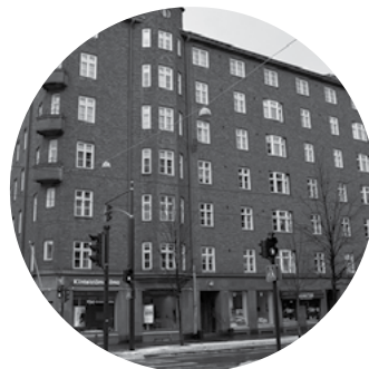
Asunto Oy Mechelininkatu 17 / Helsinki