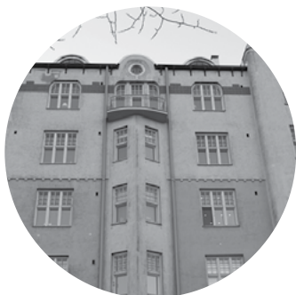
Asunto Oy Laivastokatu 8-10 / Helsinki